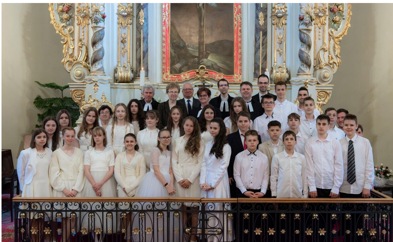
Összép a 2023. május 28-án konfirmált fiatalokról.